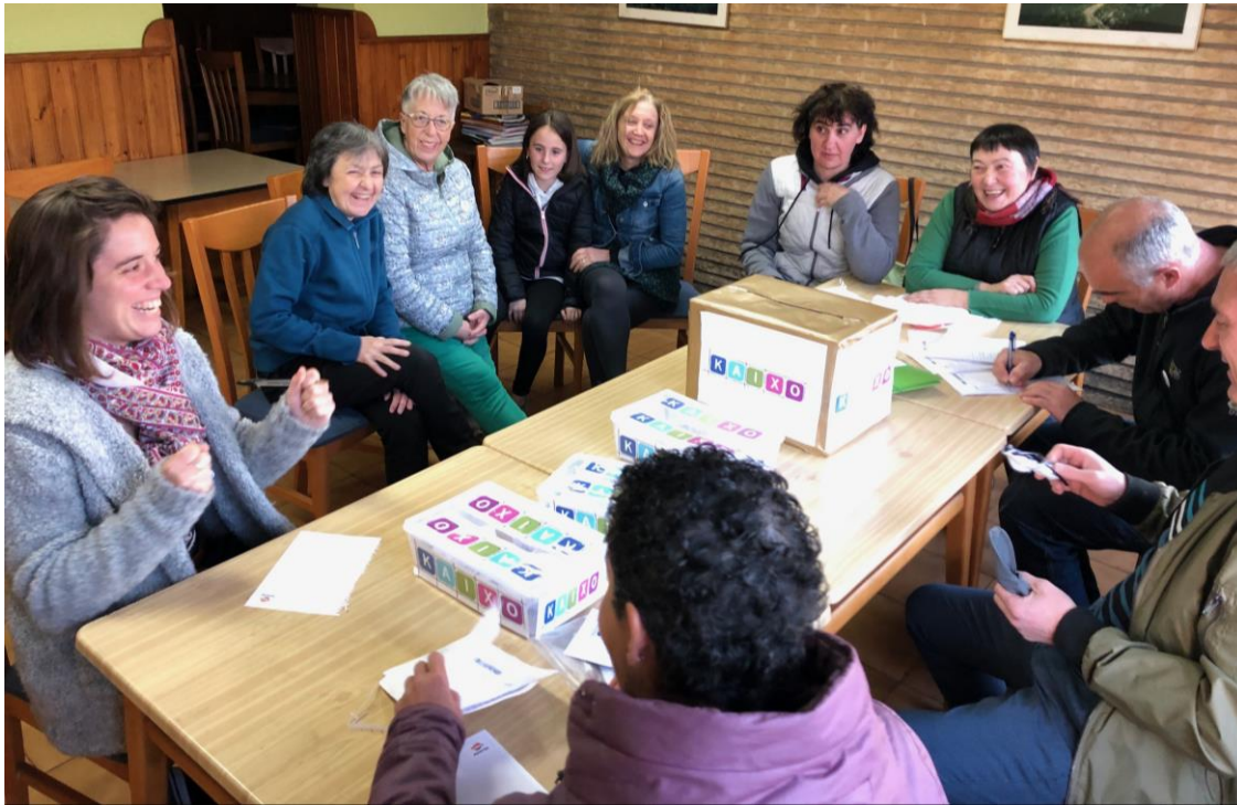
Imagen del recuento de los votos con las cuatro urnas que se repartieron por los diferentes pueblos del municipio. La alta participación ha avalado la tesis de Kaixo respecto a las primarias como método de participación ciudadana para la confección de las listas electorales.

Lógicamente, muchxs estaréis deseando conocer los resultados de estas votaciones para conocer a las y los candidatos, pero no es tan inmediato. Podemos deciros, que se han propuesto 57 nombres diferentes para completar las listas de Kaixo.